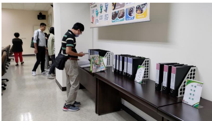
日期：112年10月19日 地點：高雄市稅捐稽徵處 參獎書面資料