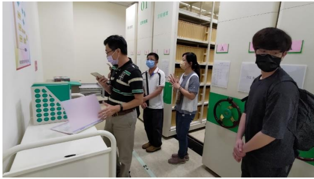
日期：112年10月19日 地點：高雄市稅捐稽徵處 檔案庫房