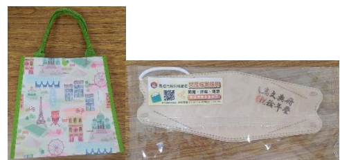
日期：112年10月19日 地點：高雄市稅捐稽徵處 檔案應用宣導品(文件夾、筆記本、環保袋、口罩)