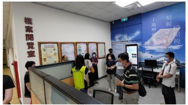
日期：112年10月19日 地點：高雄市稅捐稽徵處 檔案閱覽室