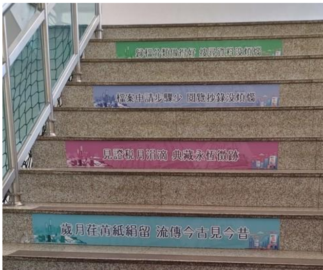
日期：112年10月19日 地點：高雄市稅捐稽徵處 宣導標語